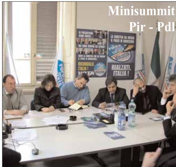
Minisummit Pir - Pdl