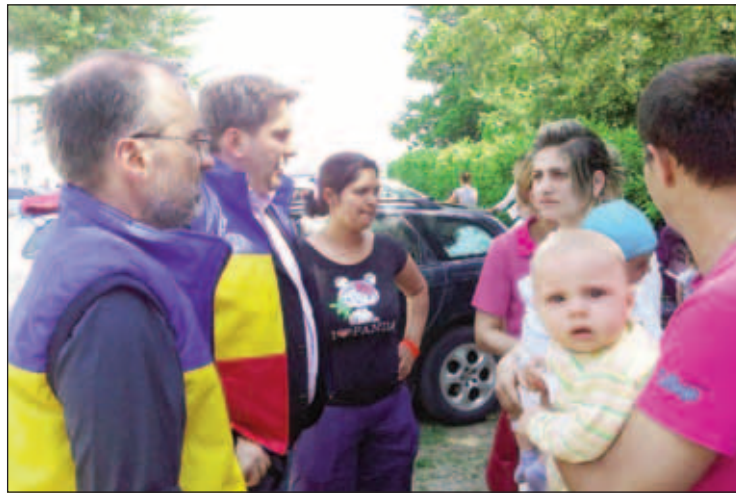
Consulul Dan Pineta (stânga), alături de sinistrații din Mirandola

După primul cutremur din Emilia Romagna, din 20 mai, românii evacuați din casele lor au încercat să se adăpostească în taberele protecției civile sau pe la prieteni. După al doilea cutremur, din 29 mai, multi sinistrați vor să plece acasă, în România. Echipete conduse de consulul Dan Pineta din Bologna au eliberat zeci de documente de călătorie pentru cei care nu se mai simt în siguranță în Italia, au rămas fără locuință sau fără loc de muncă și au decis să plece acasă. Sinistrații au fost vizitați și de deputatul Brînză, care a fost nemulțumit de reacția autorităților române.