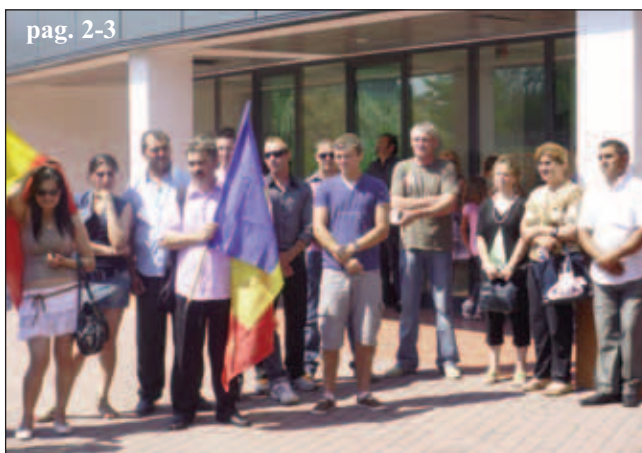
Un protest care ar fi trebuit să zguduie scaunul lui Boc