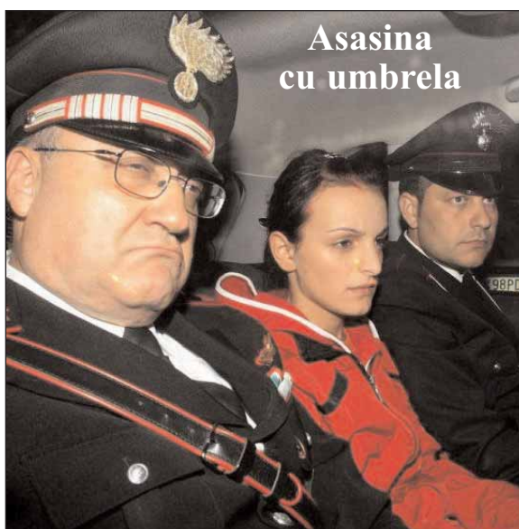
Asasina cu umbrela