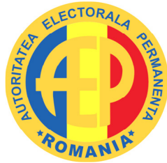
Autoritatea Electorală Permanentă